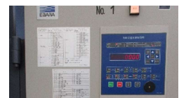
環境制御盤の導入