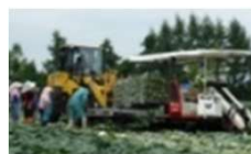
機械化体系の導入