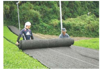
茶の被覆作業の実施